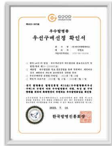
우수발명품 우선구매선정 확인서

특허등록 5종 · 출원 7종 · 벤처인증 · ISO9001 · 14001 · 여성기업 · 기업부설연구소