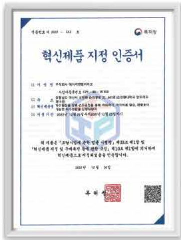
혁신제품 지정 인증서